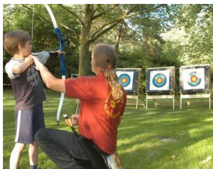
Ateliers wie Bogenschiessen, Alphorn blasen, Theaterwerkstatt etc.