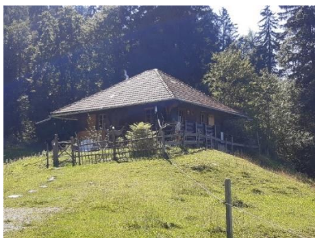
Das Zuhause - Alphütte auf der Aeschiallmi

Der Sommer und die Bergwelt rufen Mädchen und Jungs ab der 5. bis zur 7. Klasse, gemeinsam während 5 Tagen die Natur rund um die Aeschiallmi (bei Aeschiried) zu entdecken. Wir spielen und erleben Abenteuer, wandern und sitzen abends gemeinsam am Feuer, hören Geschichten und singen. Wir schauen einem Älpler beim Käsen über die Schulter und entdecken in lustigen Ateliers (Theater, Bogenschiessen, Alphorn blasen usw.) neue Interessen und Fähigkeiten. Wir übernachten in einer Alphütte oder auch im Zelt draussen. Wir teilen Freude und haben Spass zusammen.