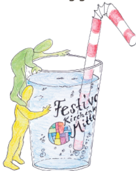
Generationsverbindendes Sommerfest