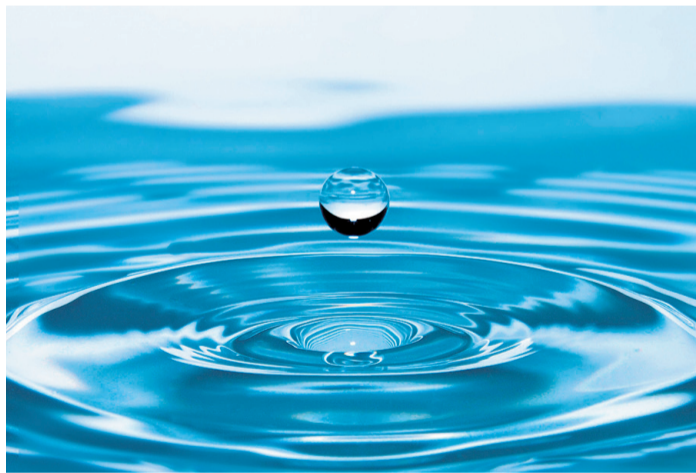
Sich mit der Quelle des Lebens verbinden

«Queer zur Quelle» – so heisst ein neues ökumenisches Angebot der queeren Kirche Region Bern. Bei einem meditativen Abendgebet verbinden wir uns mit der Quelle des Lebens und lassen uns von ihr nähren, sodass unsere Lebensenergie selbst wieder sprudeln kann.