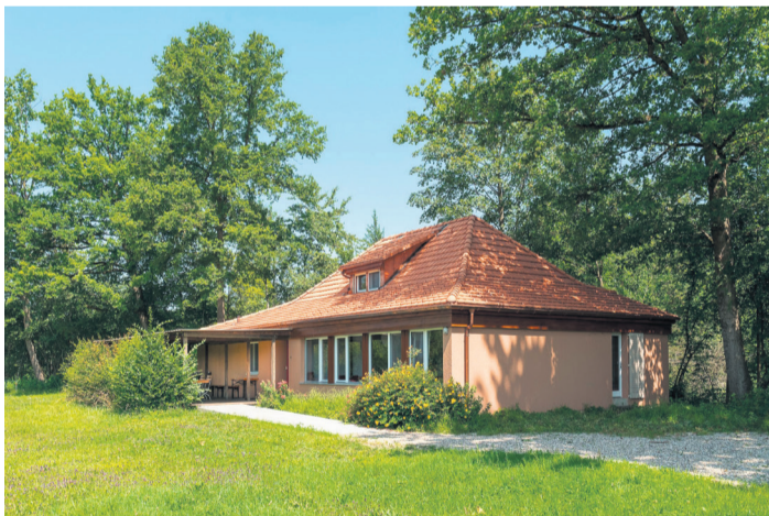
Unser Ziel im Sommer: das Aare-Hüsi Belp

Ich treffe Sebastian Stalder im Garten des Jägerheims in Belp. Gemeinsam spazieren wir zum nahegelegenen Aare-Hüsi, in das wir diesen Sommer zu einer kurzen Auszeit im Grünen einladen. Unterwegs tauschen wir Ideen zum Pilotprojekt «Gemeindeferien im Kleinformat» aus.