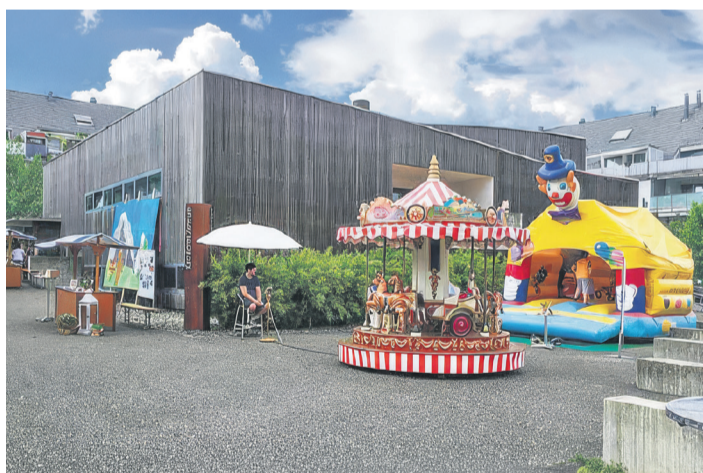
Wir feiern ein Fest für alle Generationen

«Ein Fest für alle Generationen – Seid herzlich willkommen». Unter diesem Motto findet das Sommerfest bereits zum vierten Mal im KIZ Niederwangen statt. Der Kirchenkreis freut sich auf viele Besucherinnen und Besucher: auf Familien und Kinder, verschiedene Generationen sowie bekannte und unbekannte Gesichter.