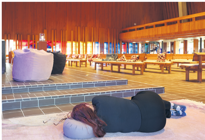
Einfach sein!

Die Ansprüche der Gesellschaft nehmen zu. Besonders für Berufstätige ist es eine Herausforderung, den Alltag zwischen Arbeit, Hobbys, Engagements, Beziehungen und Haushalt ins Gleichgewicht zu bringen. In jedem Bereich scheint die Erwartung zu wachsen, mehr, schneller und besser zu sein. «Äs längt.»