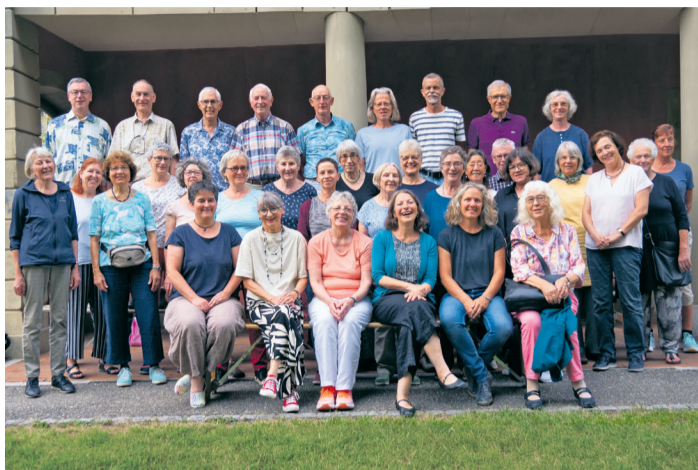
spiegelchor & Dreifchor

Der Gottesdienst am 3. Mai steht innerhalb des Kirchenjahres unter dem Titel «Kantate – Singt! Singt dem Herrn ein neues Lied, denn er tut Wunder!».