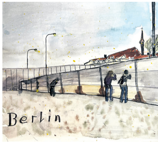
Impressionen aus Berlin

Schon die Anreise war ein kleines Abenteuer: Mit dem Nachtzug unterwegs, irgendwo zwischen Müdigkeit, Vorfreude und ersten Gesprächen, wuchs die Gruppe enger zusammen. Als wir am Morgen in Berlin ankamen, begann eine intensive Zeit voller neuer Erfahrungen. Ein besonders eindrücklicher Ort war die Not- und Schlafstelle beim Containerbahnhof. Wir erhielten eine Führung ausserhalb der Öffnungszeiten und bekamen so einen Einblick in die Arbeit vor Ort. Auch ohne direkte Begegnungen mit Betroffenen wurde deutlich, wie wichtig solche Angebote sind und wie nahe Not und Ausgrenzung auch in einer reichen Stadt sein können – oft verborgen vor den Augen der meisten. Besonders zwei Dinge bleiben in Erinnerung: 1. Man bekommt zwar ein Bett für 10 Nächte hintereinander, ist im Anschluss aber für 20 Nächte gesperrt. 2. Aufstehen muss man um 5.30 Uhr und um 7.30 Uhr das Areal verlassen haben und der Einlass ist dann ab 20 Uhr.