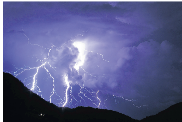
Am Anfang war ...

Das Bedürfnis, das Un-erklärte zu erklären und erträglich zu machen, lässt sich bis heute nicht eliminieren. Die Aufklärung setzte auf Wissenschaft, um es zu befriedigen. Was unerklärbar blieb, wurde den Religionen überlassen. Diese springen seither dankbar in die Lücke, die ihnen geblieben ist. Oder versuchen gar, die Wissenschaft zurückzubinden. Doch ist das der Anfang von Religionen?