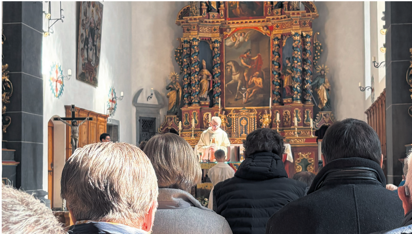
Sinnlich-liturgische Eucharistiefeier in der Kirche Kippel anlässlich des Josefstags am 19. März