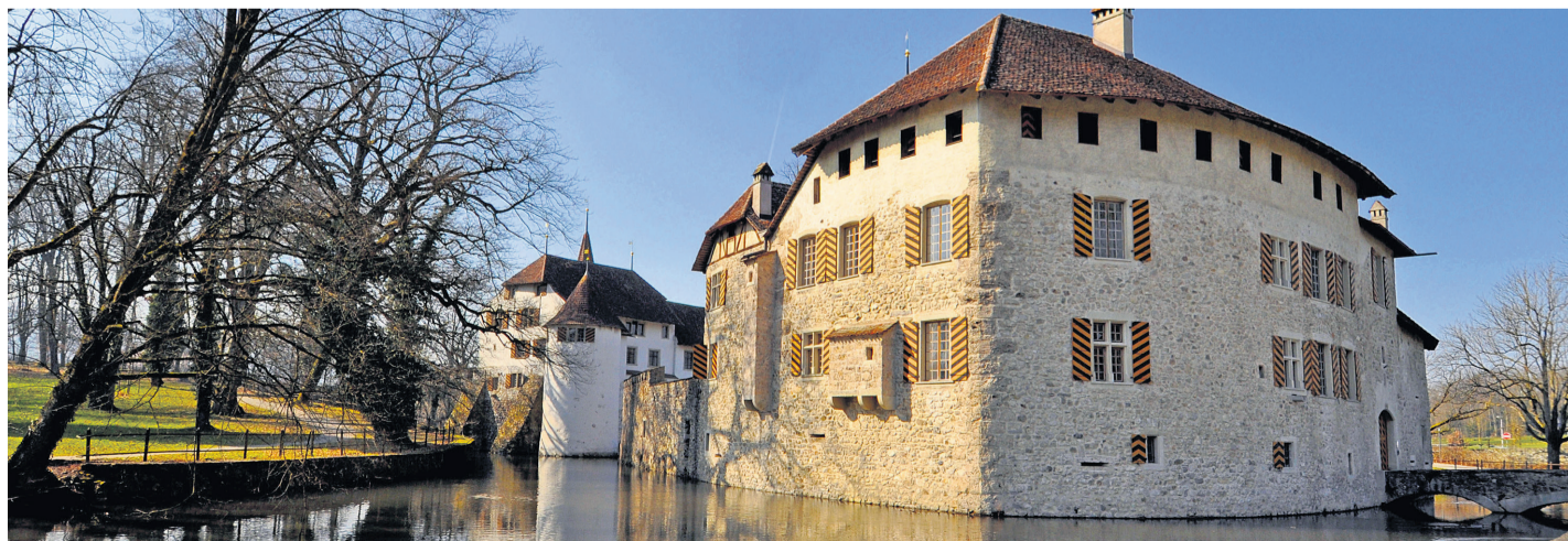
Zeitreise ins Mittelalter im Wasserschloss Hallwyl.

Ökumenischer Gemeindeausflug mit Ziel Hallwilersee