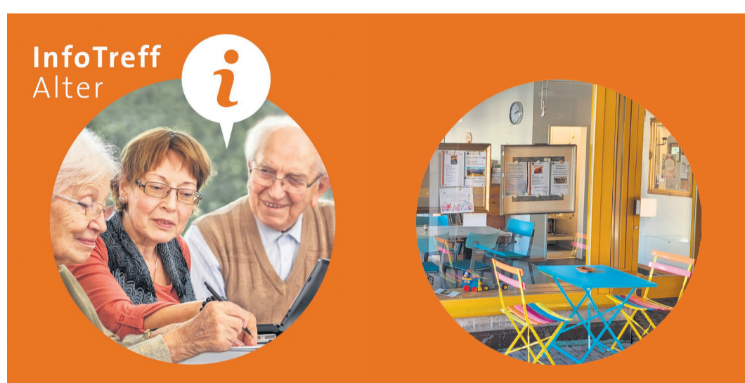
Der InfoTreff Alter in Niederscherli – unverbindlich, ohne Anmeldung und kostenlos

Die schwierige Aufgabe des Älterwerdens müssen Sie nicht allein bewältigen. Es gibt viele Menschen, die Sie gerne begleiten, sei es als Freiwillige, Familienmitglieder oder Professionelle. Jede Begegnung ist gleichzeitig ein Geben und Nehmen und