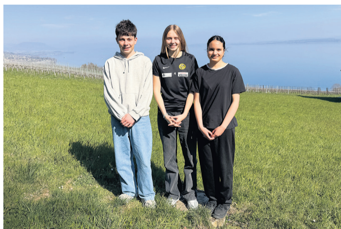
Diese drei Jugendlichen werden im Mai konfirmiert.