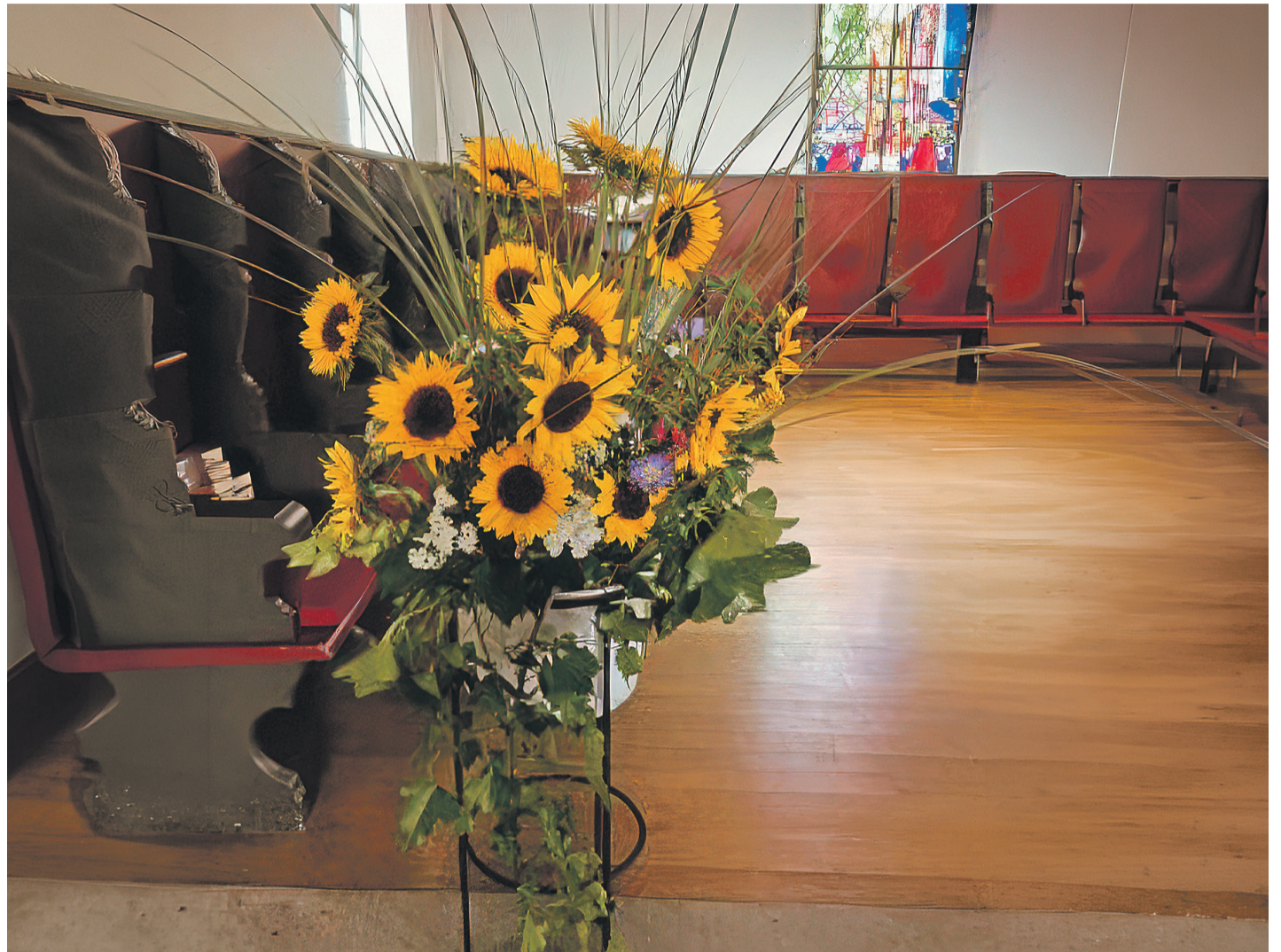
Liebevoll gestalteter Blumenschmuck in der Kirche Niederscherli