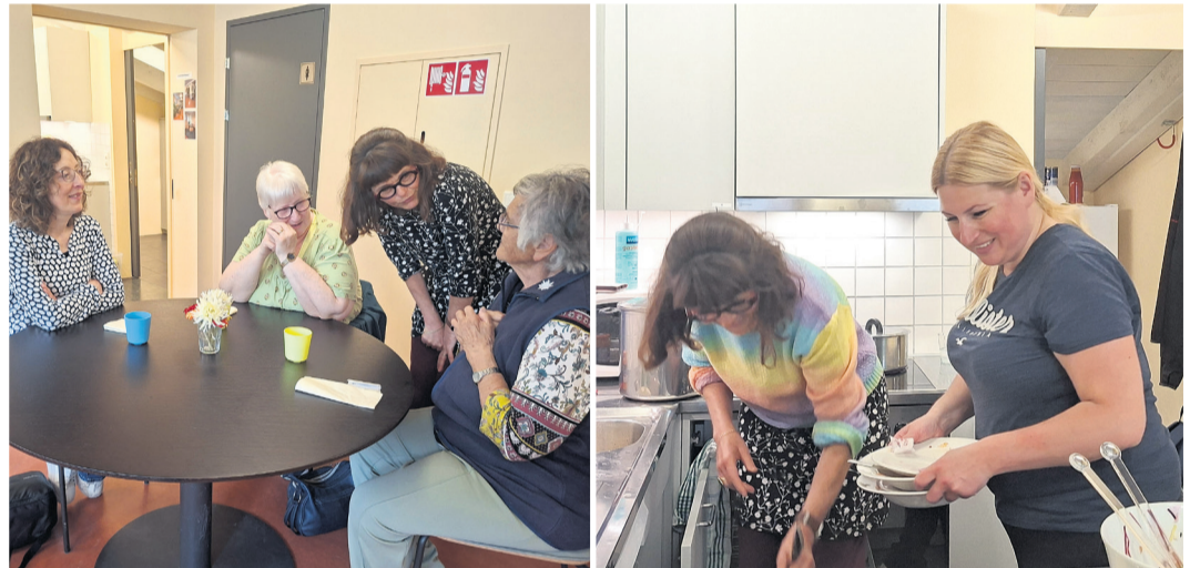
Gross und Klein essen gemeinsam zu Mittag.