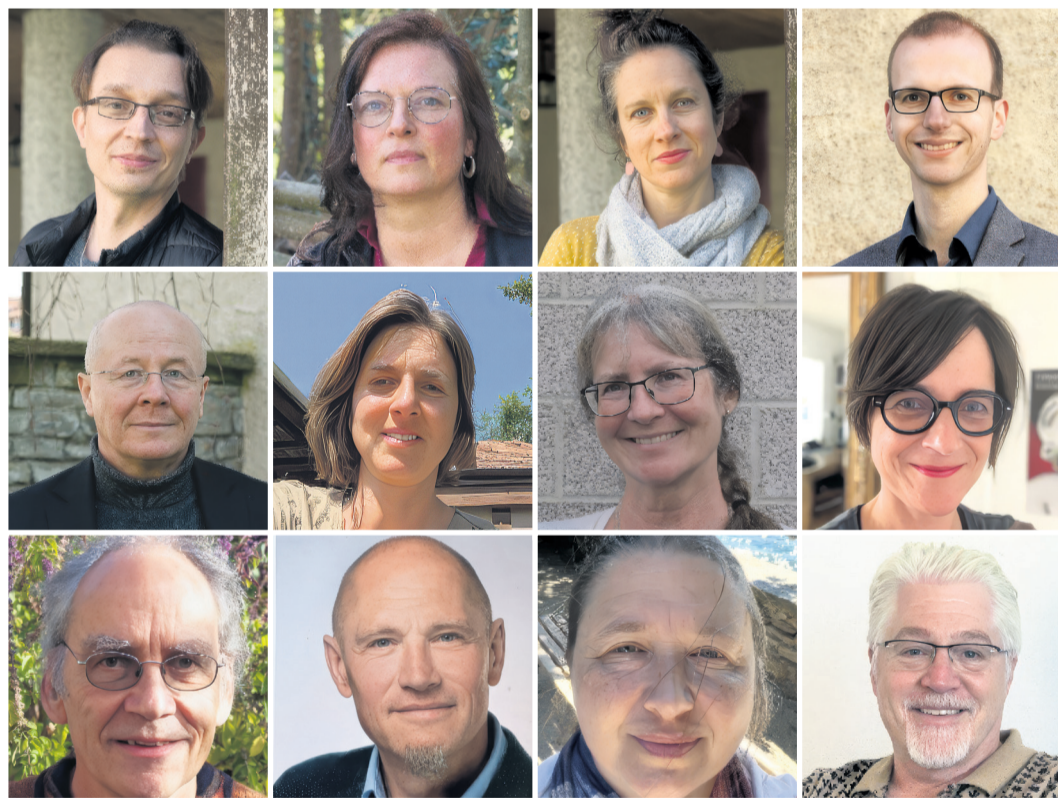
Das Team des Kirchenkreises Wabern

Die Schlange an der Kasse des Giessenbads Belp bewegt mich dazu, an der Badi vorbei über das Giessenbrüggli und am Restaurant Jägerheim vorbei zum von