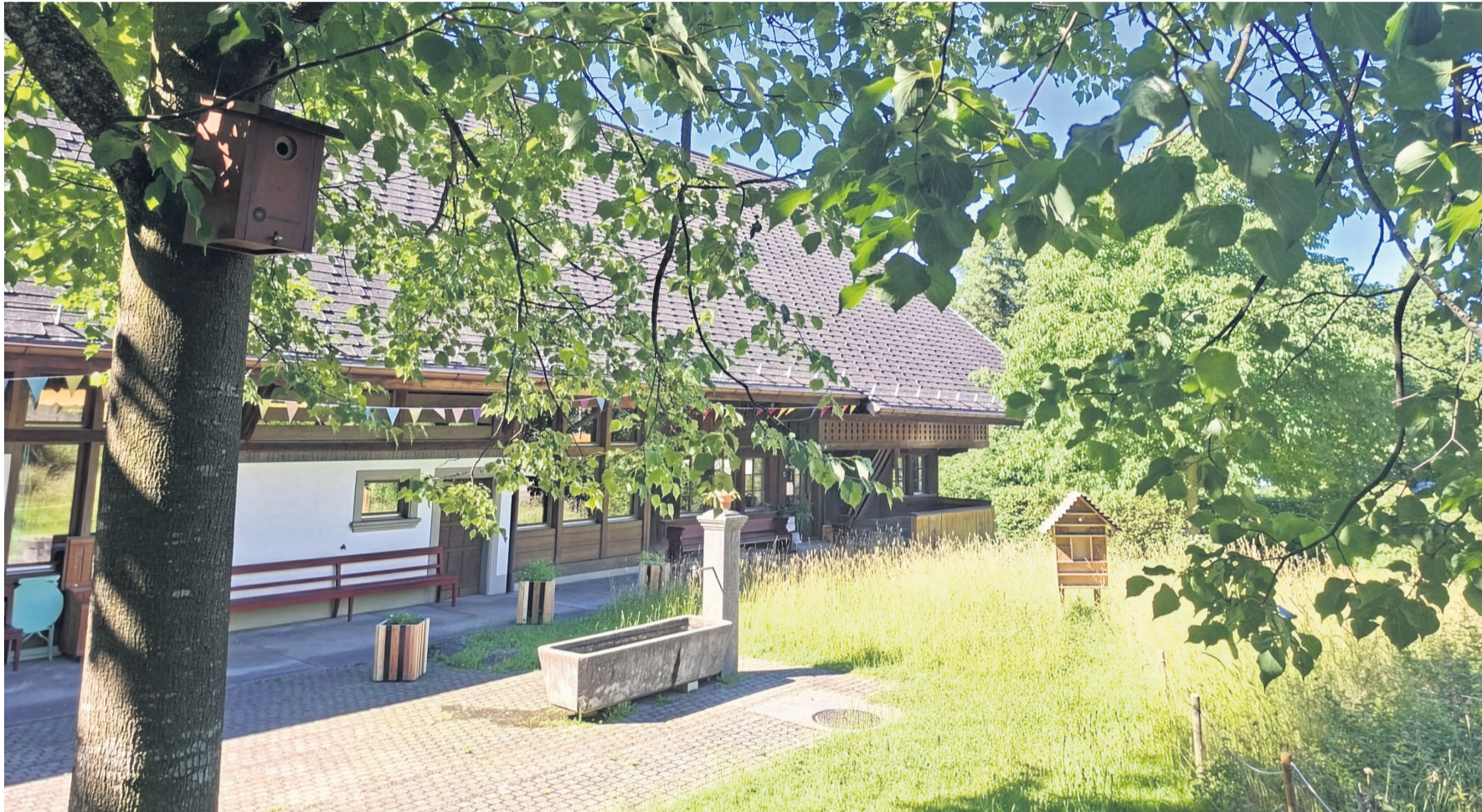
Bunter Lebensraum: Einheimische Wildpflanzen wachsen rund um das Murrihuus Schlieren

Die Kirchgemeinde Köniz setzt sich für Biodiversität ein, wie die Beispiele aus Wabern und Schliern zeigen: Hier kehrt die Natur zurück!