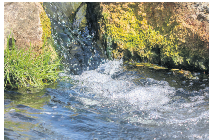
Am Bach