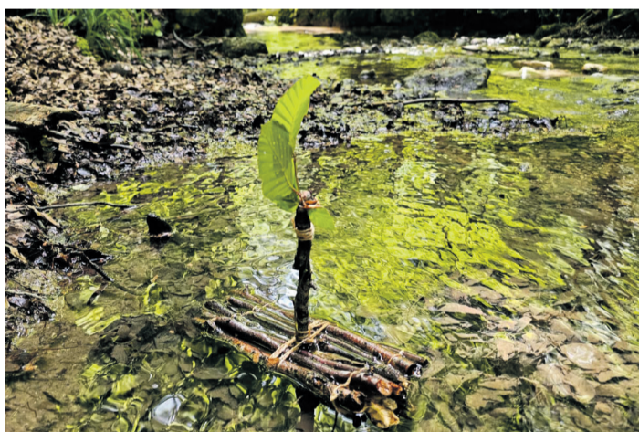
Mit Stein und Schiffli durch die Verenaschlucht

Ende Mai machten wir uns mit den Kindern auf den Weg in die Verenaschlucht bei Solothurn. Es war ein herrlicher Frühsommertag und viele spannende Entdeckungen lagen vor uns. Schon zu Beginn suchten sich die Kinder einen Stein auf dem Weg, den sie während des ganzen Ausflugs mit sich trugen. Der Stein stand für Ängste, Sorgen oder Dinge, die manchmal schwer auf dem Herzen liegen. Zum Glück waren die meisten Steine leichter als die Rucksäcke auf dem Rücken! Auf unserem Weg bestaunten wir die Natur, lauschten dem Plätschern des Wassers und besuchten eine kleine Kapelle. Dort wurde es für einen Moment ganz still – und die Kinder durften eine Kerze anzünden. Passend zum Thema hörten wir die biblische