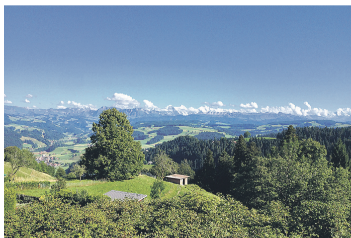
Mit dem Car besuchen wir das Emmental

Wir reisen mit dem Car durch die schöne Emmentaler Landschaft Richtung Moosegg/Emmenmatt. Auf fast 1'000 m ü. M. geniessen wir bei schönem Wetter ein feines Zvieri auf der Gartenterrasse des Gasthofs Waldhäusern mit Sicht auf Eiger, Mönch und Jungfrau. Bei schlechtem Wetter gibt es natürlich auch ein Zvieri. Es bleibt Zeit für Gemeinschaft, Spiele und einen Spaziergang. Unser Ausflug findet am Mittwoch, 12. August ab mittags statt (siehe Info); um ca. 18.15 Uhr kehren wir zurück. Die Kosten betragen 32 Franken pro Person (inkl. Carfahrt und Zvieri; Getränke im Restaurant auf eigene Kosten).