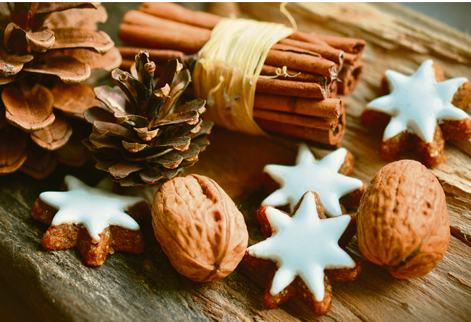
Sich mit Nüssen und «Güzzi» auf Weihnachten einstimmen