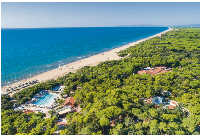
Juhee, hier verbringen wir unsere Gemeindeferien!

Vom 19. bis 26. September 2026 verbringen wir unsere Gemeindeferienwoche in Italien im «Paradù Resort» in der Toskana.