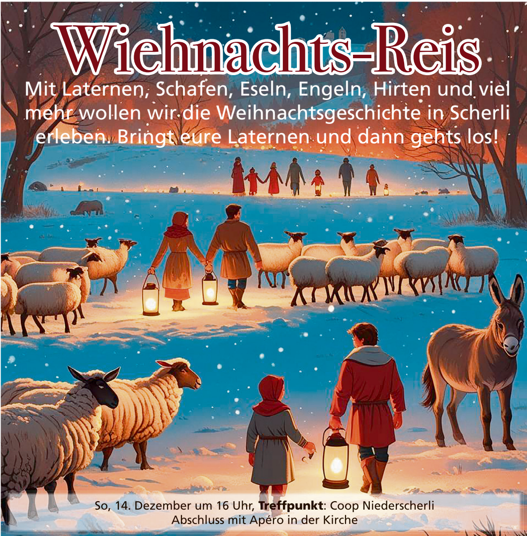
Eine spannende Reise wartet auf uns.