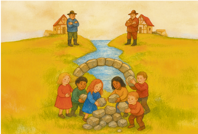
Eine Brücke bauen

Alle Daten finden Sie in der Agenda unter der Rubrik Gottesdienste.