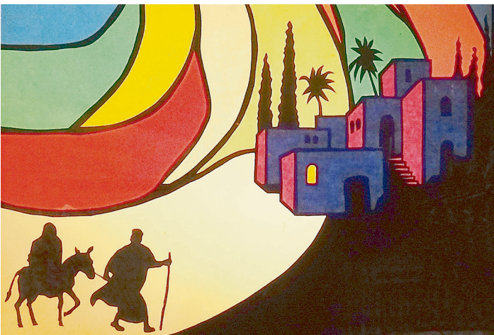
Wir freuen uns auf Weihnachtsfeiern für Jung und Alt.