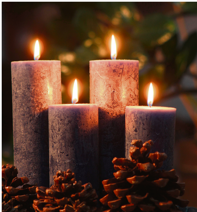
Das Weihnachtsfest kommt näher!