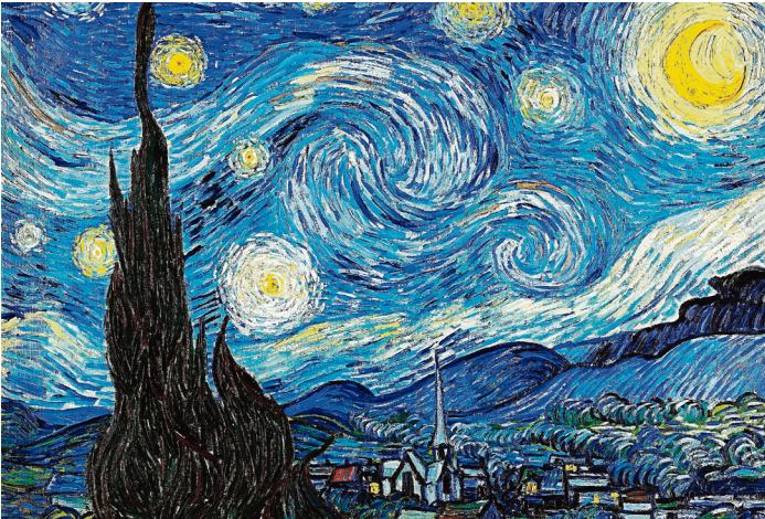
Replik von Vincent van Goghs «Sternennacht»