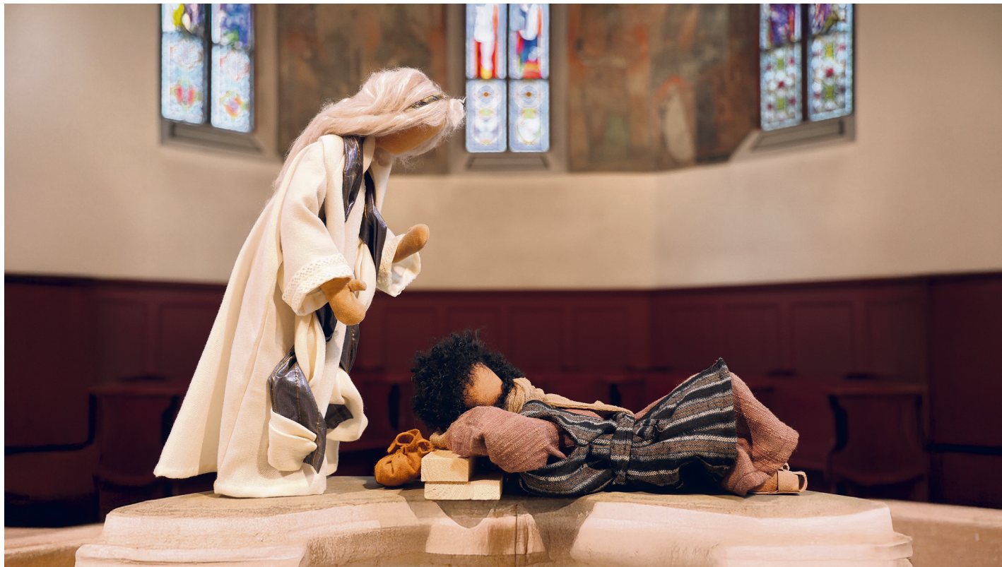
Szene aus der Weihnachtsgeschichte – dargestellt von Krippenfiguren in der Kirche Köniz

In der Bibel gibt es zwei verschiedene Geschichten, die von der Geburt Jesu erzählen. Die eine steht im Lukasevangelium, die andere im Matthäusevangelium. Die anderen beiden Evangelien (Markus und Johannes) verzichten auf eine Geburtsgeschichte Jesu und beginnen ihr Evangelium anders. Vermutlich ist Ihnen die Geburtsgeschichte aus dem Lukasevangelium geläufiger, oder zumindest der Teil daraus, der üblicherweise im Gottesdienst an Heiligabend gelesen wird – und vielleicht auch bei Ihnen zu Hause? «Es geschah aber in jenen Tagen, dass ein Erlass ausging vom Kaiser Augustus, alle Welt solle sich in Steuerlisten eintragen lassen