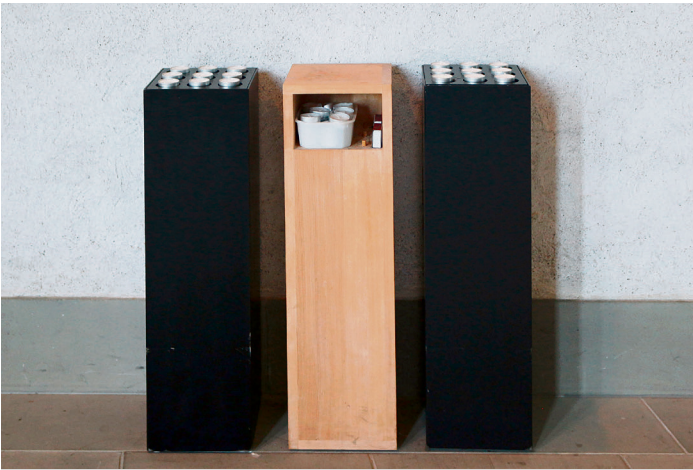
Licht und Stille im Kirchenraum

● INFO Fr, 30.1., 27.2., 27.3., 24.4., 22.5., 26.6., 15–17 Uhr, Kirchgemeindesaal Kosten: 40 Franken (Richtwert) 6 bis 8 Teilnehmende Anmeldung (bis 9.1.): Eva Schwegler, 031 978 32 73, eva.schwegler@kg-koeniz.ch